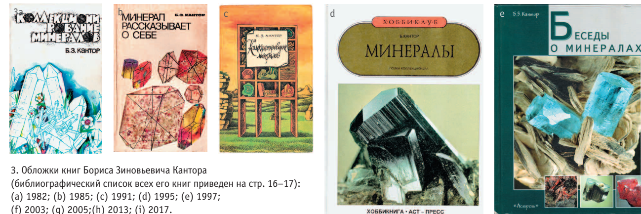
3. Обложки книг Бориса Зиновьевича Кантора (библиографический список всех его книг приведен на стр. 16–17): (a) 1982; (b) 1985; (c) 1991; (d) 1995; (e) 1997; (f) 2003; (g) 2005; (h) 2013; (i) 2017.