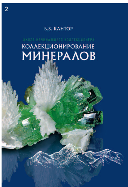
2. Обложка десятой книги Б.З. Кантора, вышедшей в 2022 году.