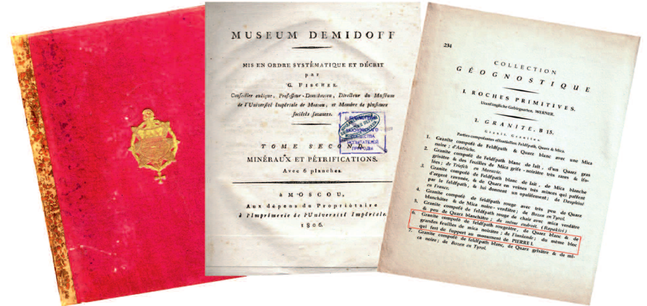
3. Каталог коллекции (музея) П.Г. Демидова — обложка, титульный лист и стр. 234 (Museum Demidoff, tome 2. Minéraux et pétrifications, publiée par le prof. Fischer, à Moscou, 1806). Библиотека МОИП, Москва.