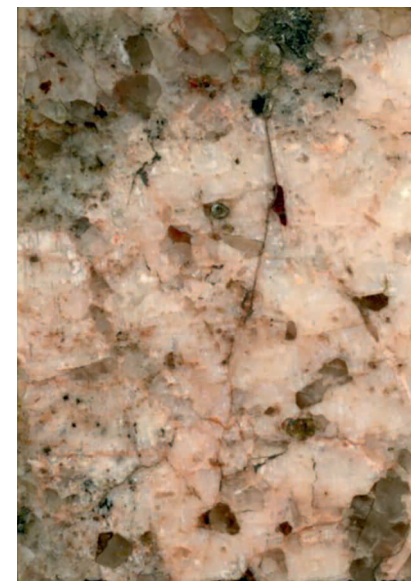
4. Пластиночки из отколов «Гром-камня». Образцы: Государственный геологический музей им. В.И. Вернадского, РАН, #ИЛ-94, ИЛ-96, ИЛ-97, из коллекции П.Г. Демидова, 1803 г.