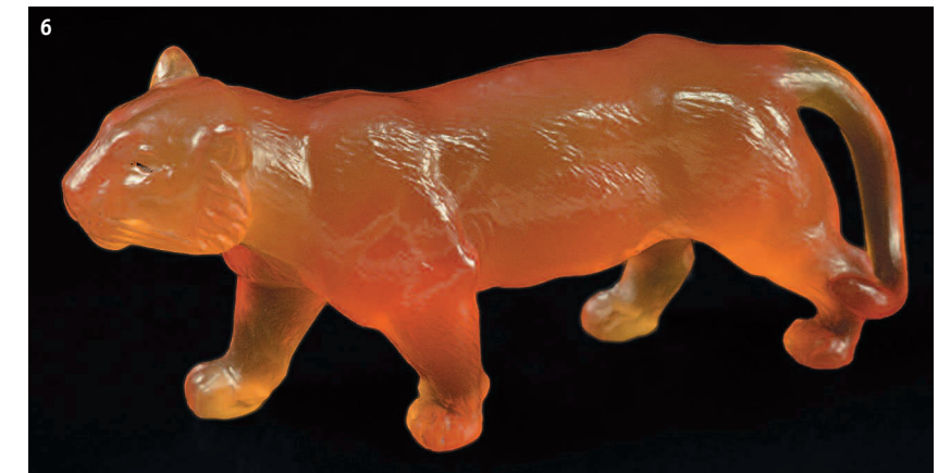
6. Тигр (сердолик). 5.1 x 2.8 x 2.3 см. Россия. Конец XIX – начало XX в. ПМ1316.