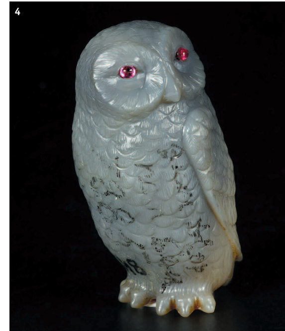
4. Филин (халцедон, рубин). 2.5 x 2.6 x 5.2 см. Фирма К. Фаберже(?), Россия. Начало XX в. ПМ1348.