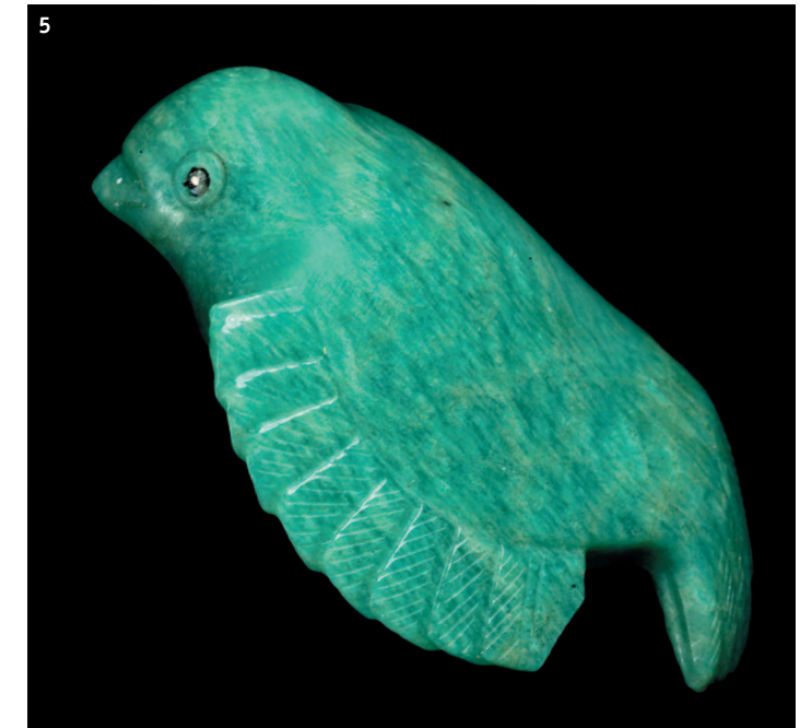
5. Клюющий воробей (амазонит, алмазы). 3.3 x 3.5 x 0.6 см. Фирма К. Фаберже, Россия. Конец XIX – начало XX в. ПМ1243.