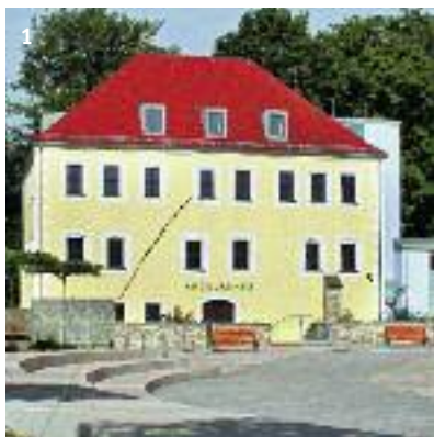
1. Вид на Крюгерхаус.