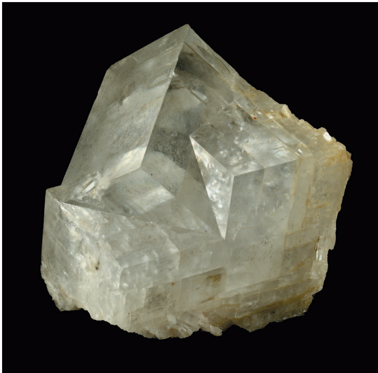
Доломит (двойник прозрачных ромбоэдров). 20 x 18 см. Онотское месторождение, Черемховский район, Иркутская область, Южная Сибирь, Россия. Частная коллекция.