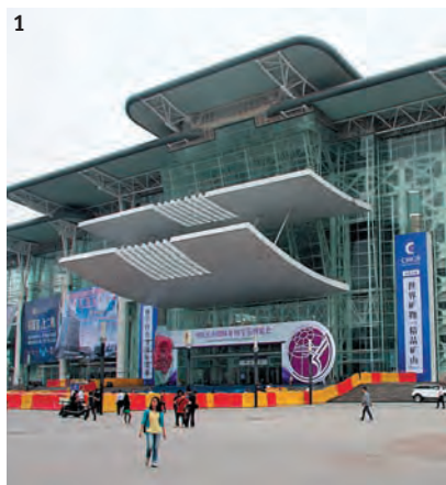
1. Хунаньский выставочный центр, где проходила Вторая ярмарка минералов и драгоценных камней.

Минералогический музей Фрайбергской горной академии, Германия