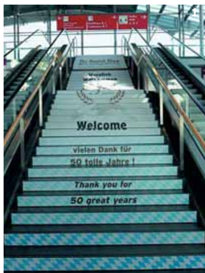
1. Юбилейная лестница.