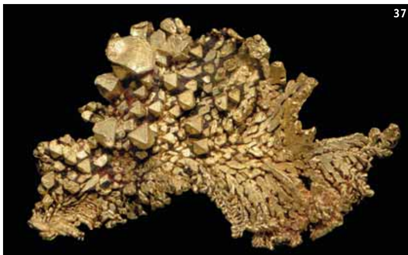
37. Кристаллическое золото. Айриш Крик. Колима, Plase Co., Калифорния, США. Музей Минералогии и Геологии, Гарвардский Университет, США.