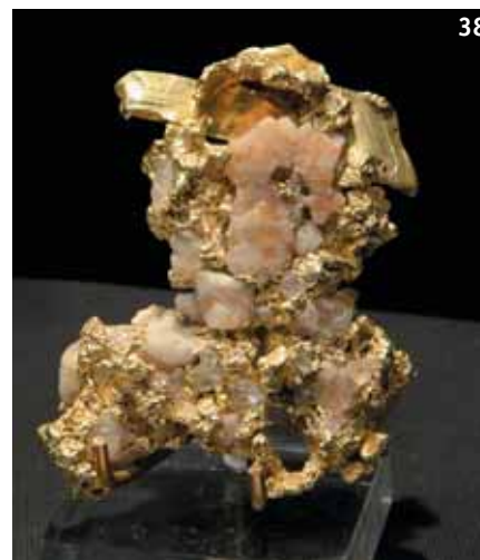
38. Золото. Грэйв Ярд Хилл, Джеймстаун, Tuolumne Co., Калифорния, США. Частная коллекция.