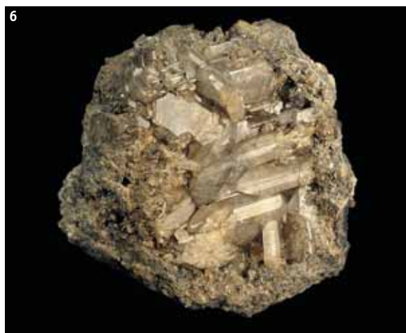
3. Друзовый сросток кристаллов уссингита . 10 см. Пегматит Шкатулка, рудник Умбозеро, г. Аллуайв, Ловозеро, Кольский п-ов.