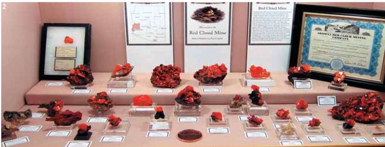
2. Экспозиция на Главном шоу – образцы вульфенита из рудника Ред Клауд, Аризона, США.

Минералогическое шоу в Тусоне 2012 года по размаху мало отличалось от предыдущих лет – оно было огромным и ошеломительным, как и ожидалось. Одно отличие, тем не менее, неизменно присутствует и заключается в том, какие экспонаты будут отобраны для Главного шоу (TGMS), проводимого Тусонским минералогическим обществом в конференц-центре Тусона. Каждый год у этого шоу новая тема, и каким-то непостижимым образом, несмотря на все величие прошлых достижений, новое шоу каждый раз порождает ажиотаж и восторженные отзывы. В 2012 году темой стали «Минералы Аризоны», и выставка собрала огромное количество образцов,