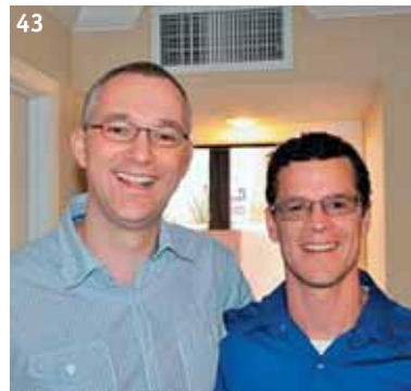
41–43. На церемонии открытия выставки «Минералы Аризоны» в университете.