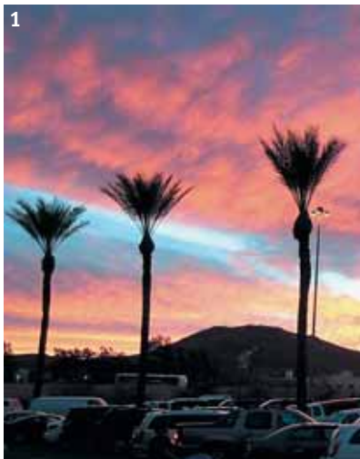
1. Закат над Тусоном.