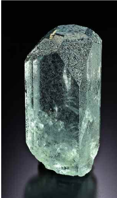
Голубой топаз , 5.3 x 2.7 см. Танакамияма (Танокамияма), г. Оцу, префектура Шига, область Кинки, остров Хонсю, Япония.