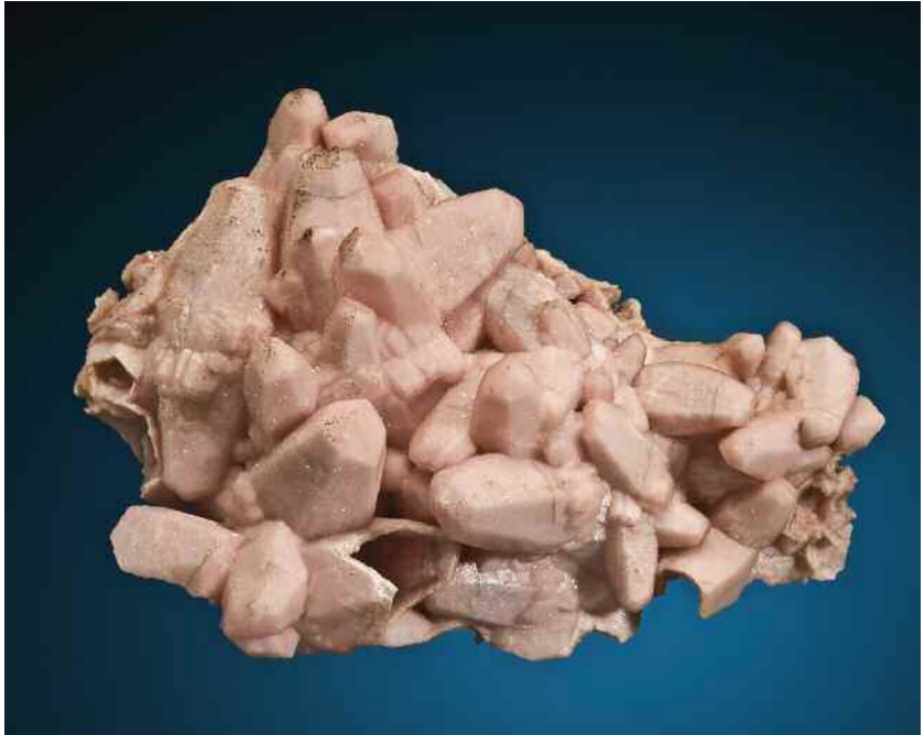
Родохрозит , псевдоморфоза по кальциту, 7.5 x 4 см. Миямото, Когу, префектура Яманаши, Япония.