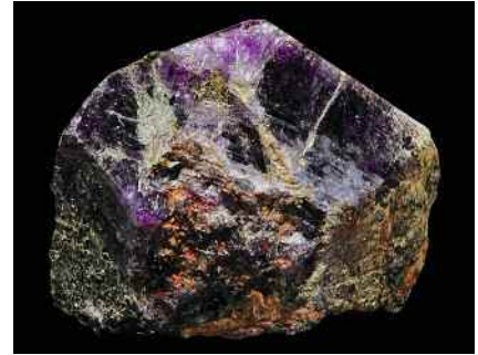
Аметист , 10 x 21 см. Копь Южакова, Мурзинка, Урал, Россия. ММК No 13208.