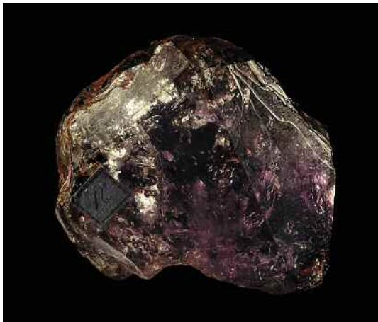
Топаз с морионом и амазонитом , 7 x 10 см. Ильмены, Урал, Россия. ММК No 3160.