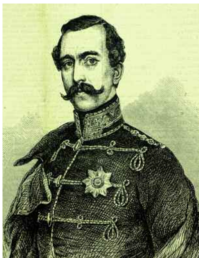
Герцог Максимилиан Лейхтенбергский. Живописный портрет.

Государственное минералогическое собрание, Мюнхен