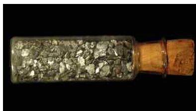
Иридий осмий , 57.8 граммов. Кыштым, Урал, Россия. ММК No 18322.